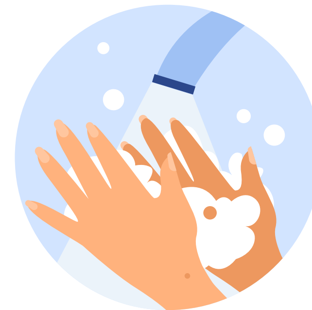
Миття рук з милом перед уроками

Керівник та засновник закладу освіти відповідає за те, щоб у медичному пункті були необхідні засоби та обладнання: безконтактні термометри, дезінфектори, антисептики для рук, засоби особистої гігієни та індивідуального захисту.